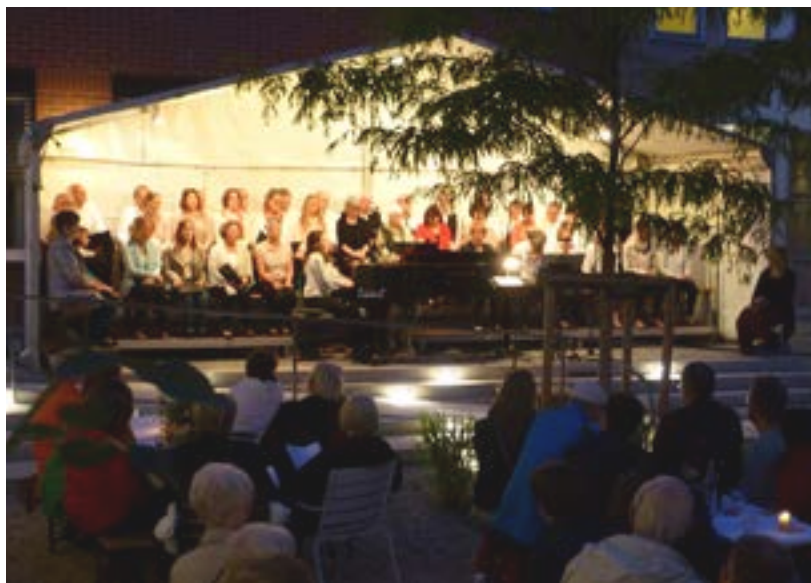
Wein- und Musik-Abend im Juli 2016