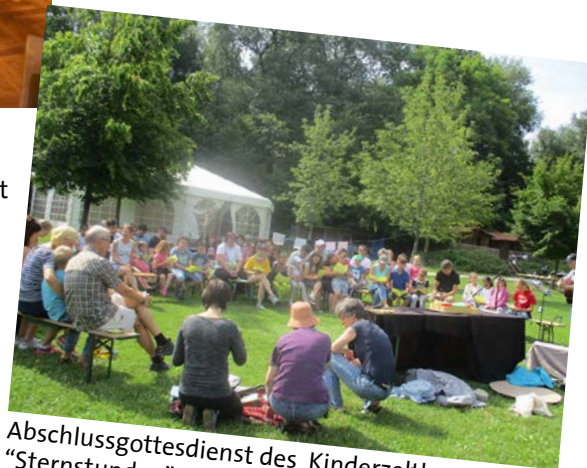
Abschlussgottesdienst des Kinderzeltlagers "Sternstunden" am Baggersee am 8. Juli