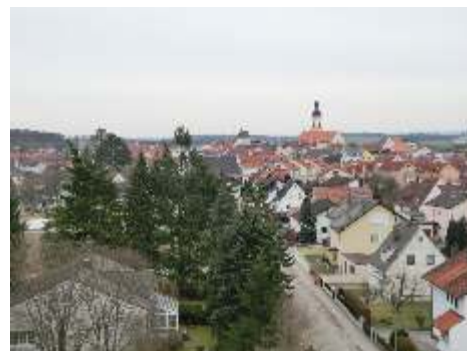
(Bild: Christoph Schürmann, seltene Aussicht auf Kösching vom Turm des neuen Gemeindezentrums!)

Seniorenachmittage in St. Paulus Ein Nachmittag bei Kaffee und Kuchen, ein Plausch mit netten Mitmenschen, dazu interessante Beiträge und Vorträge und gemeinsames Singen. Das finden Sie am Seniorenachmittag in St. Paulus. Und wenn Sie nicht gut zu Fuß sind, können wir für eine Mitfahrgelegenheit sorgen. Melden Sie sich doch einfach mal im Pfarramt unter der Telefonnummer 0841/58585. Nächste Termine: Donnerstag, 6. April & 4. Mai um 14.30 Uhr im Gemeindesaal