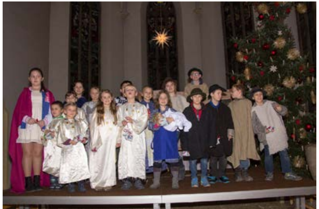
Schlussbild des Krippenspiels am Heiligen Abend 2015

So reden die Kinder über die Rollen, die sie beim Krippenspiel einnehmen. Sie sagen nicht: „Ich spiele einen Hirten“, sondern sie sind es. Das mag für eine unkomplizierte Beziehung der Kinder zu ihren Rollen sprechen.