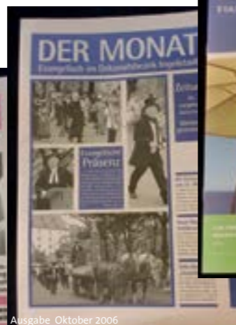
Ausgabe Oktober 2006