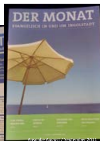
Ausgabe August / September 2011

Natürlich möchten wir Sie auch in Zukunft über die Ereignisse in unseren Kirchengemeinden informieren. Damit