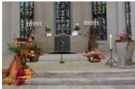
Erntedank 2015

Festgottesdienst zum Erntedankfest 2.10., 10:00 Uhr , mit BläserInnen gleichzeitig Kindergottesdienst Pfarrer Christian Bernath Anschließend Gemeindefest mit Mittagessenbuffet und Kaffee und Kuchen sowie Kinderprogramm.