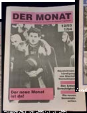
Ausgabe Dezember 1993 / Januar 1994