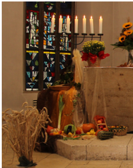
Erntedankaltar 2014

wie schön der Hof geworden ist. Er eignet sich gut für Veranstaltungen, Feste und Konzerte. Wir danken schon jetzt, wenn Sie an uns denken.