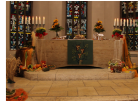
Erntedankaltar 2014

Am Sonntag, 4. Oktober beginnt um 10:00 Uhr unser Gemeindefest mit einem festlichen Gottesdienst in der Matthäuskirche. Der Altar wird wieder fröhlich und farbenfroh geschmückt sein.