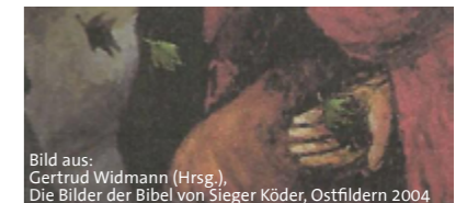
Bild aus: Gertrud Widmann (Hrsg.), Die Bilder der Bibel von Sieger Köder, Ostfildern 2004