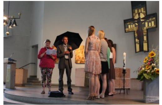
Zum Abschied ein Schirm. Wer unter dem Schirm des Höchsten ...

Mit einem Gottesdienst in dem der alte Jugendausschuss verabschiedet und der neue eingeführt wurde, ging es los: unser zweites Mitmachfest. Hatte es im letzten Jahr fast durchgehend geregnet, wurden wir in diesem Jahr mit Sonne satt verwöhnt, fast zu sehr verwöhnt. Der Hitze geschuldet bauten wir Bänke im Schatten der Kirche und