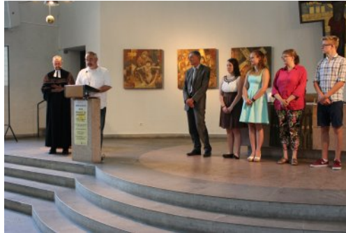
Einführung des neuen Jugendausschusses

auch im Park auf, wo es sich am besten aushalten ließ. Viele gute Gespräche wurden geführt, miteinander gefeiert und auch zusammen auf- und abgebaut. Unser etwas anderes Gemeindefest, zeigte sich wieder als entspannte Variante, die allen das Mitmachen und Mitfeiern erlaubte. Ein Mitmachfest halt.