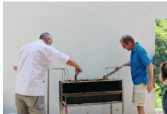
Meister am Grill

AUS DATENSCHUTZGRÜNDEN VERÖFFENTLICHEN WIR IN DER INTERNETAUSGABE KEINE GEBURTSTAGE, TAUFEN, TRAUUNGEN UND BESTATTUNGEN.