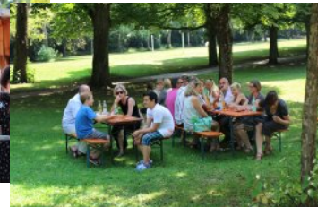
Im Park ließ es sich aushalten