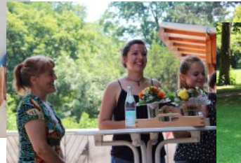
Blumen für engagierte Ehrenamtliche