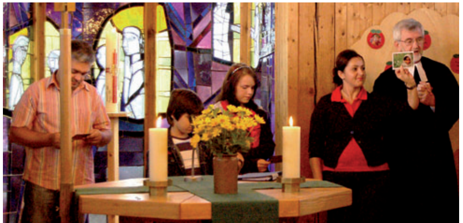
Familiengottesdienst zum Jakobusfest im Jahr 2010.